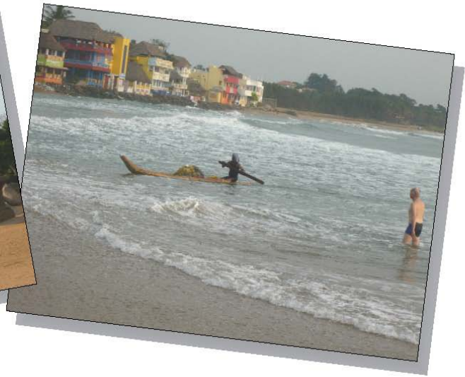
Mamallapuram: 5 Rathas und beim Baden im Meer